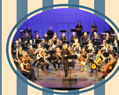
Orchestre Symphonique de Chabeuil