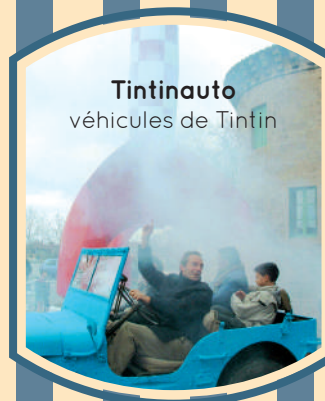
Tintinauto véhicules de Tintin