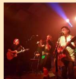
« Le clan » concert groupe celtique