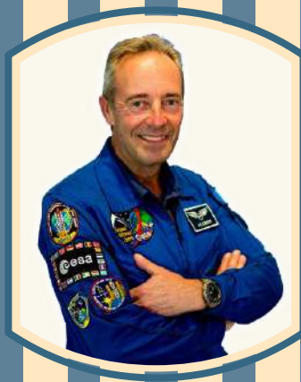
Jean-François CLERVOY Entretien avec un astronaute