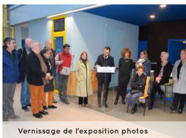
Vernissage de l'exposition photos

Attention, seuls les mails comportant : âge, adresse, numéro de téléphone et personnage féminin inspirant seront conservés en vue d'une éventuelle participation. Merci de votre compréhension.