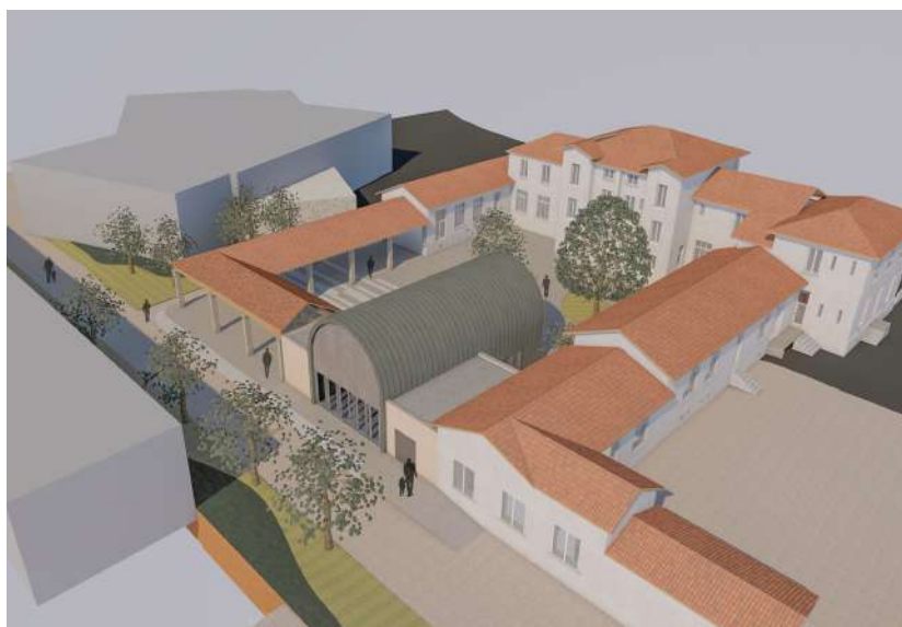
Voilà à quoi va ressembler le nouvel espace autour de Cuminal