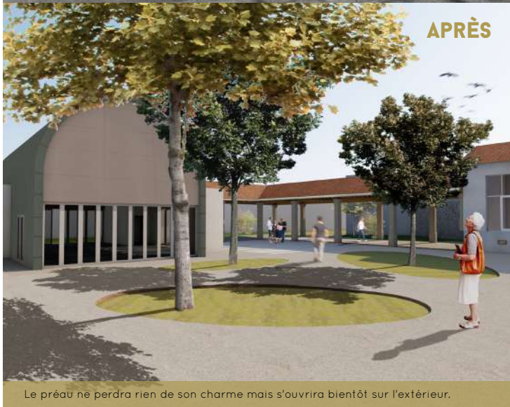
Le préau ne perdra rien de son charme mais s'ouvrira bientôt sur l'extérieur.