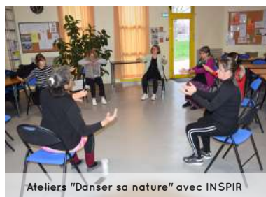
Ateliers "Danser sa nature" avec INSPIR