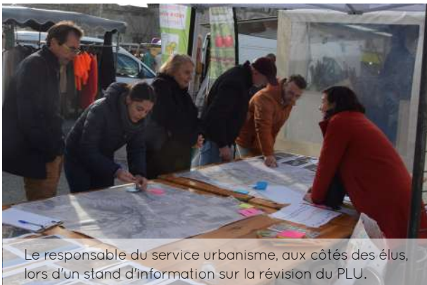
Le responsable du service urbanisme, aux côtés des élus, lors d'un stand d'information sur la révision du PLU.

A l'échelle d'une ville, les enjeux en termes d'urbanisme sont relativement importants. Il s'agit avant tout de maîtriser le développement urbain et trouver le juste équilibre entre croissance économique, construction de logements et préservation de l'environnement.