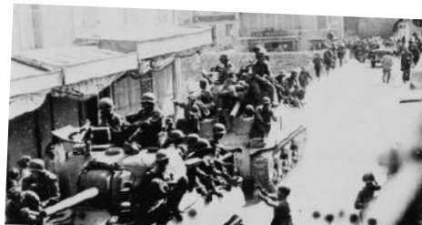
Distribution de chewing-gums par les américains au Faubourg de l'Hôpital lors de la Libération 1 Juin 1944

Tous les ans, le 27 mai, dans le cadre de la journée Nationale de la Résistance, la municipalité organise, en coopération avec Daniel Cuoq, président des FFI de la Drôme, une cérémonie patriotique pour rendre hommage à la mémoire de ces jeunes héros tombés pour la France.