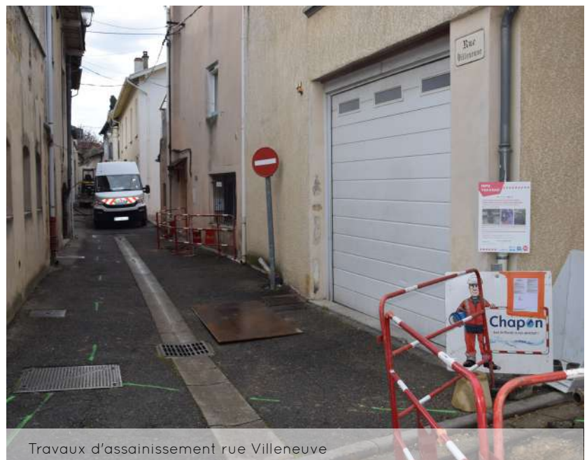
Travaux d'assainissement rue Villeneuve