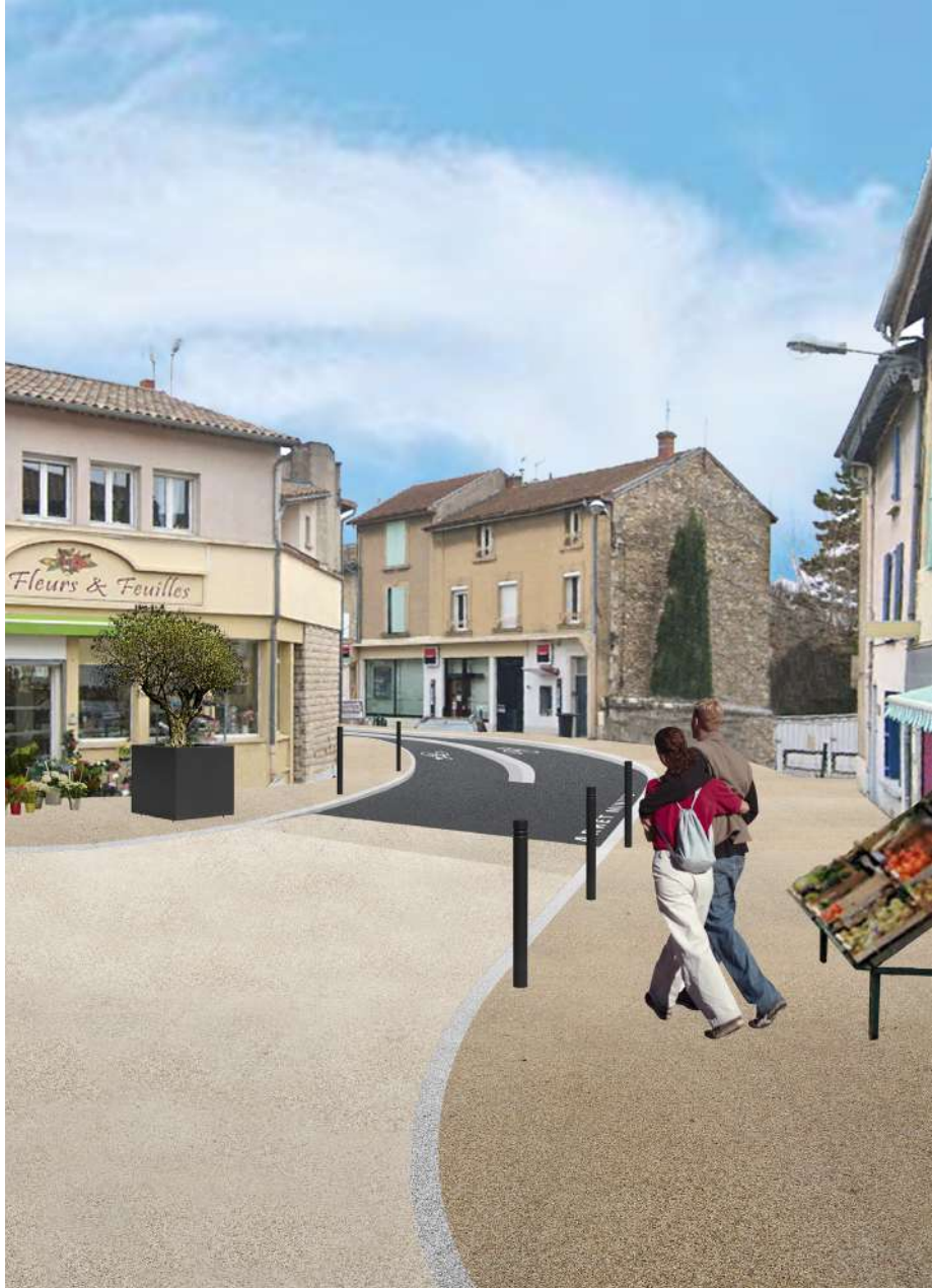
Voilà à quoi va ressembler le Faubourg de l'Hôpital en octobre ! Projection réalisée par le Cabinet David

Pour tout savoir sur les travaux et la fermeture du Faubourg de l'Hôpital, rendez-vous le 26 juillet au centre culturel à 18 heures.