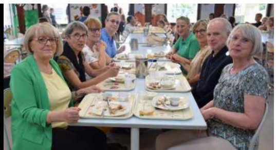
En fin d'année les bénévoles de Lire et faire lire ont mangé à la cantine.