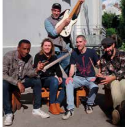
Le groupe Nomad's

Danse Avenue (sur inscription). On peut trouver la chorégraphie pour s'entraîner sur notre site et sur notre page Facebook.