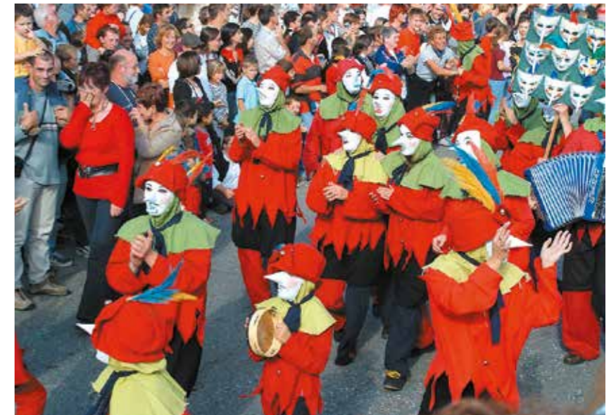
100 costumes de Turlurons doivent être fabriqués pour le défilé 2023

Tout a commencé au Festival de la BD d'Angoulême par une rencontre entre un fou de Tintin, Guy Bois, aujourd'hui décédé, grand collectionneur, et un autre fou de Tintin... et de fusée, le