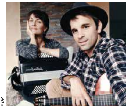
Chauffe Marcel fera danser le 14 juillet

Le couronnement d'une journée organisée avec le comité des fêtes qui proposera concours de pétanque et buvette. Et place de la Poste, après avoir assisté au feu d'artifices, ce sera l'heure de danser aux sons du groupe Chauffe Marcel et de ses reprises !