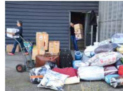
50m 3 de matériel ont été offerts par les habitants de Chabeuil et des environs

Dès les premiers jours du conflit, une collecte gérée par 3 ONG (Aides Actions Internationales Pompiers, Pompiers Missions Humanitaires et Pompiers de l'Urgence Internationale) a été mise en place dans les locaux de la Ville. En une semaine, 50 m 3 de matériel (vêtements, couvertures, matériel de puériculture ou paramédical) ont été apportés. L'ensemble des dons a été acheminé par Transaginat dans centre de tri en Pologne qui se charge ensuite de les partager entre différents camps de réfugiés.