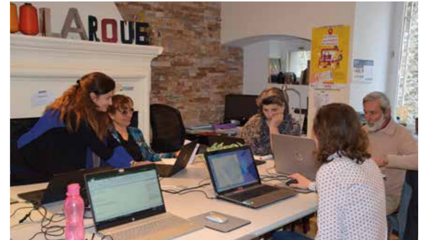
Les ateliers de La Roue permettent de faire les premiers pas avec internet

Ici, tout est fait pour que les plus éloignés de ces modes de communication puissent trouver les réponses à leurs interrogations et ne pas craindre de se lancer, grâce à des cours collectifs proposés tous les lundi et jeudi, des ateliers d'accompagnements ponctuels et des postes connectés en accès libre, aux heures d'ouverture. Quant aux formations collectives, elles sont prises en charge à 100 %, à travers le dispositif Pass Numérique (lire ci-contre).